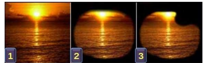
Выпадение полей зрения при глаукоме